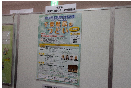
千葉県 環境生活部くらし安全推進課